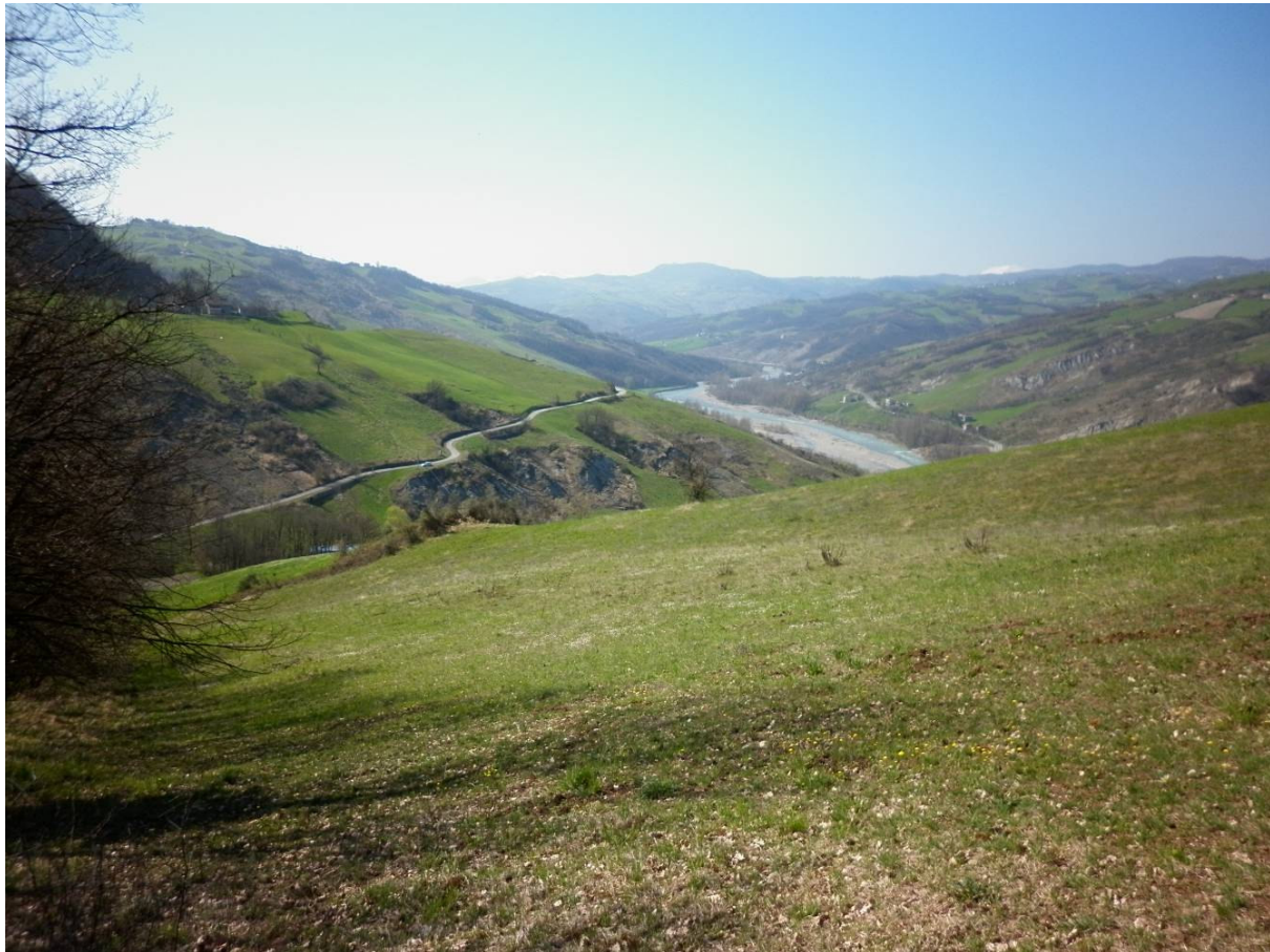
Una veduta panoramica della valle del Panaro