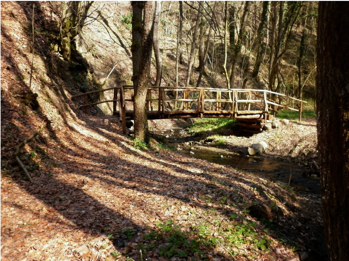
Uno dei numerosi ponti che attraversano il Fosso Frascara.