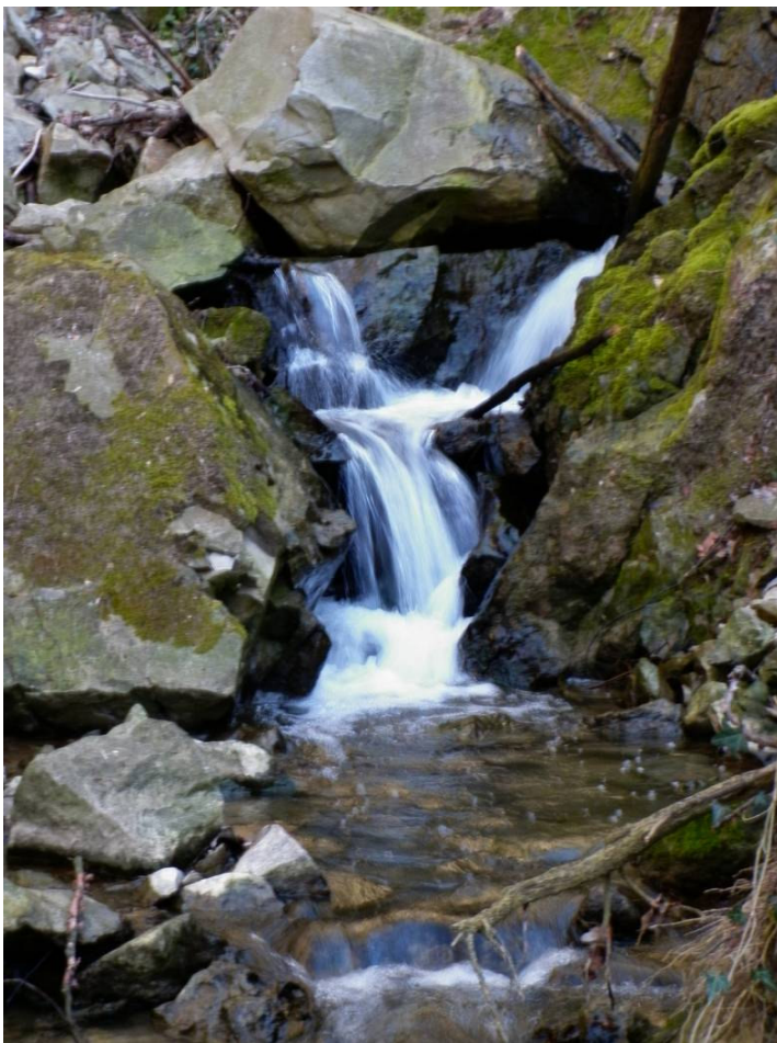
Una piccola cascata.