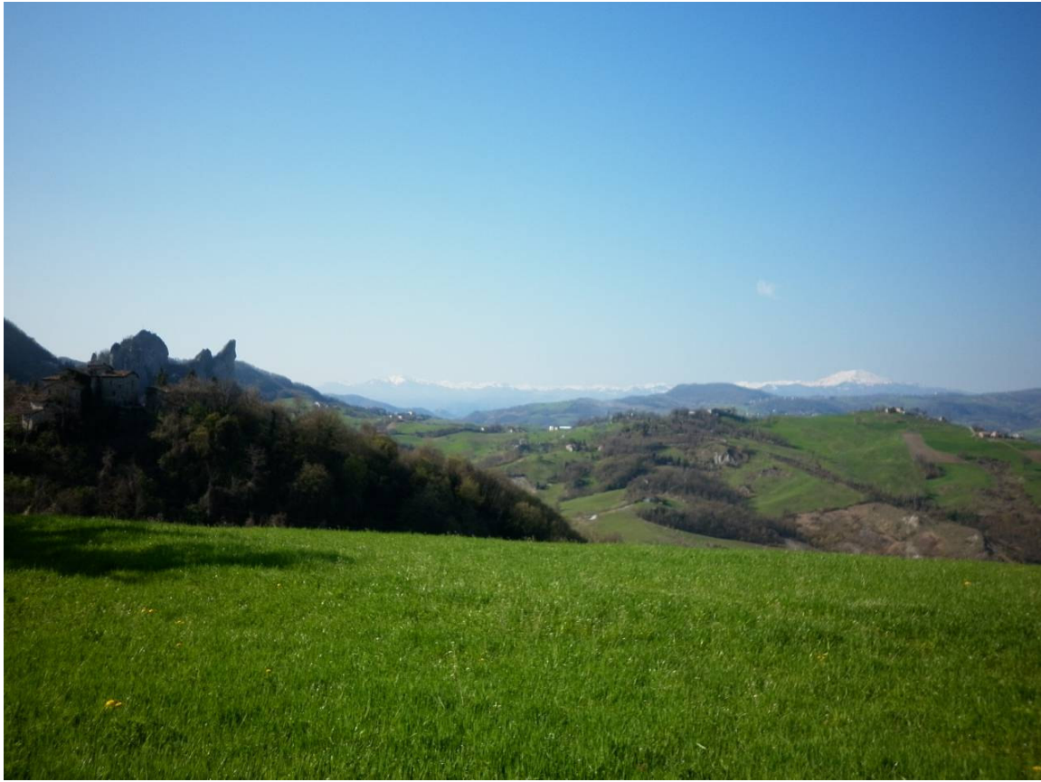
Veduta dei Sassi di Roccamalatina e del monte Cimone da Pieve di Trebbio.