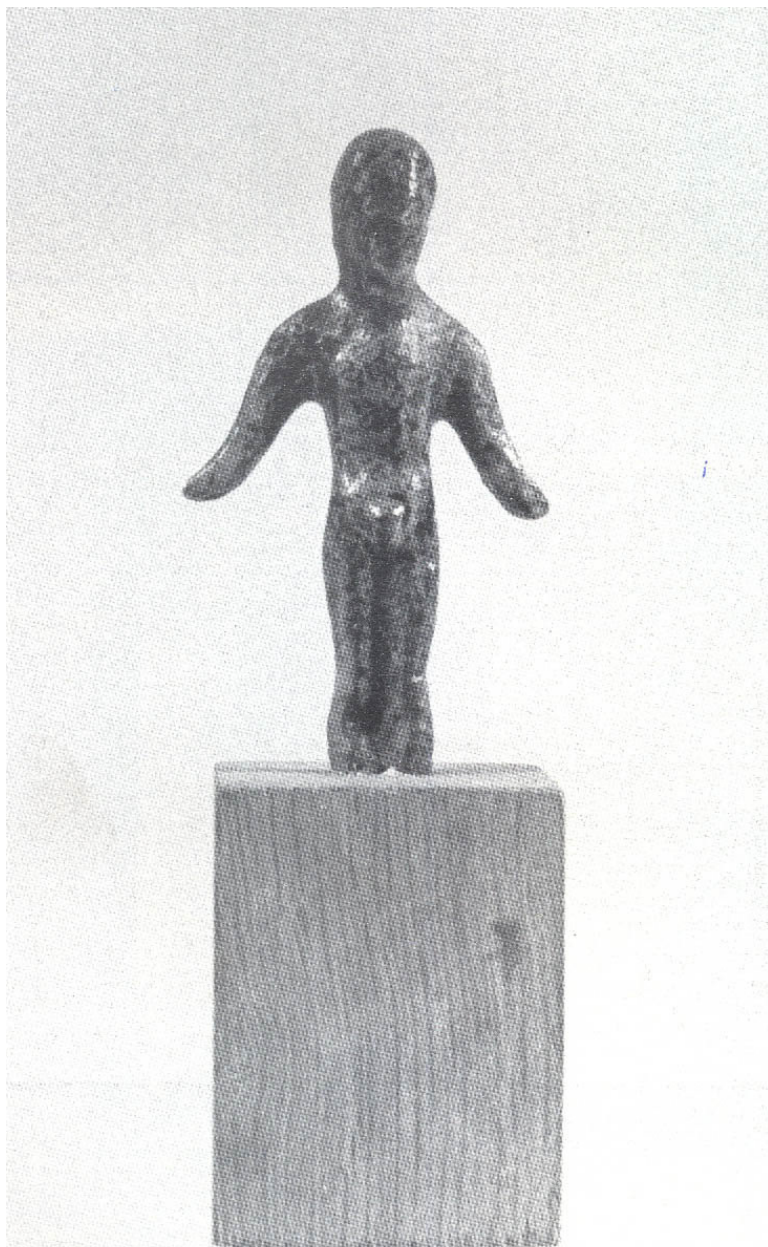
Il Bronzetto di Borgofreddo (età etrusca)

La località chiamata Borgofreddo si trova all'ingresso del paese, venendo da Guiglia, a destra. Qui alla fine dell'800 è stato ritrovato un bronzetto votivo schematico di età etrusca , che rappresenta un offerente nudo, di sesso maschile, con le braccia abbassate e scostate dal corpo, che manca dei piedi. Questo reperto è attualmente conservato al Museo Civico Archeologico di Modena, che noi della Redazione abbiamo contattato nella speranza ci possano fornire qualche particolare in più su questo "tesoro" di Rocca semisconosciuto ai più.