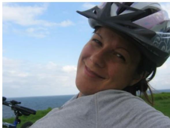
Io in versione sport: paracadutista e ciclista