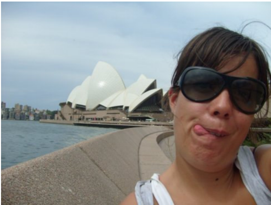
Ciao a tutti da Sydney!