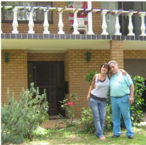
Io e lo zio d'Australia