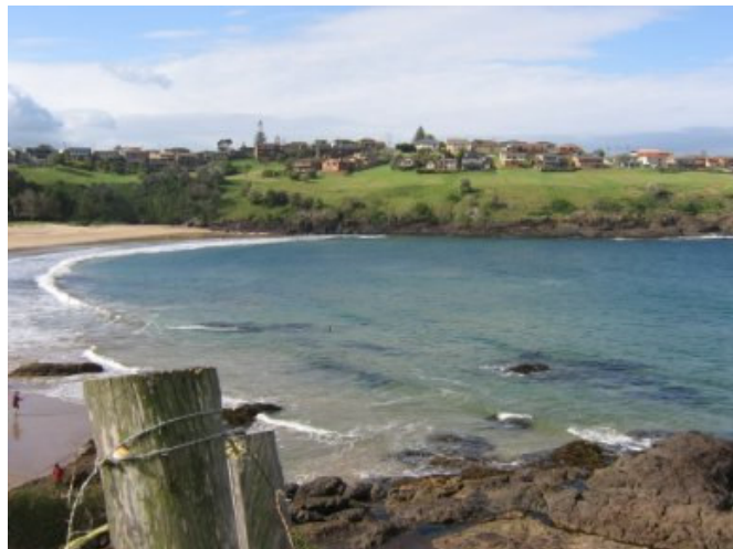
La spiaggia vicino a casa