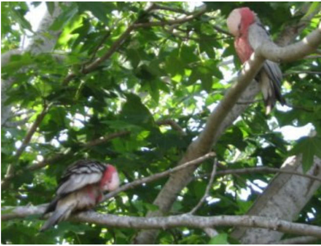
I pappagalli – sveglia