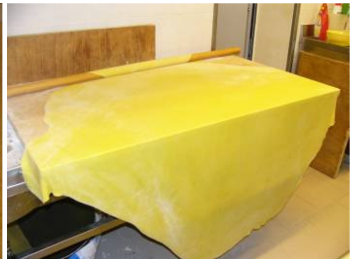
Finiamo con queste foto che non riguardano proprio strettamente la serata del 2 agosto, ma sono il miglior biglietto da visita del locale...: le tagliatelle "della Santina"!