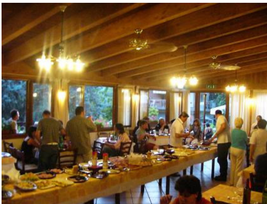
Il Buffet, nell'unico istante in cui non era assalito da migliaia di persone affamate