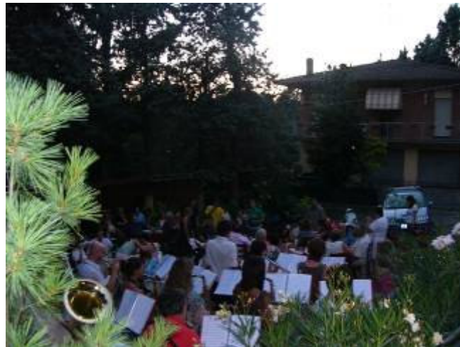
Il cortile del Ristorante gremito di ospiti