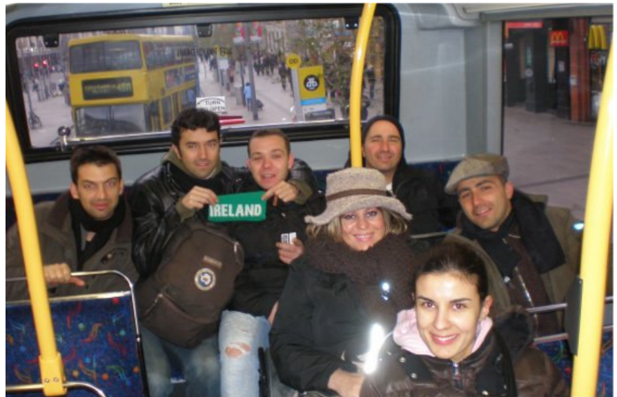
La delegazione in un momento di svago.