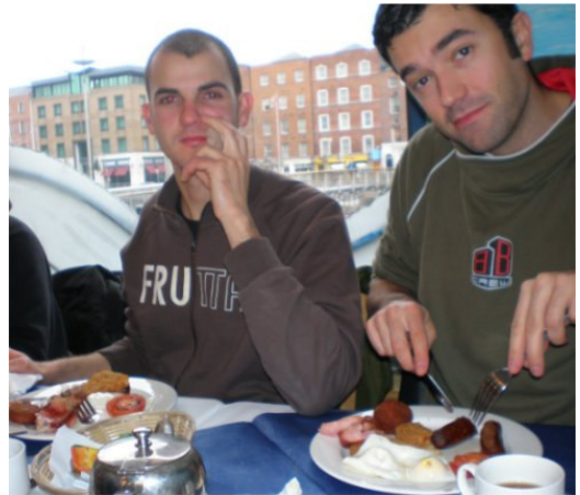
Tradizionale colazione irlandese