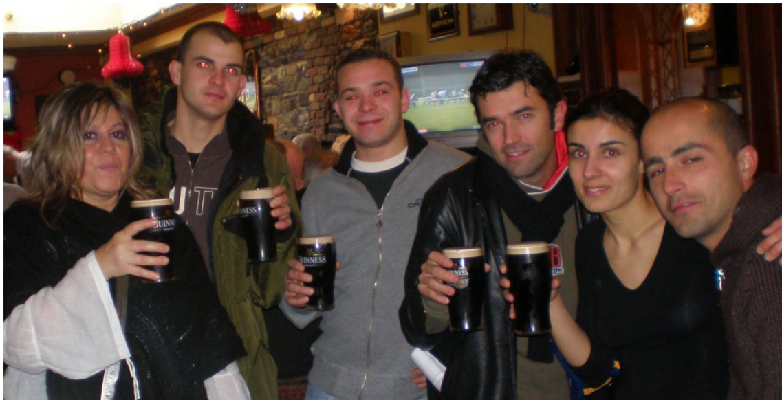
Assaggio di una tipica bibita locale in una Public House (sopra e sotto)