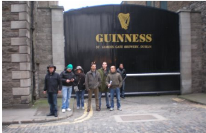
La delegazione davanti all'azienda irlandese