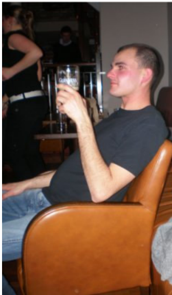
Il Sindaco ad una conferenza dei giovani agricoltori.