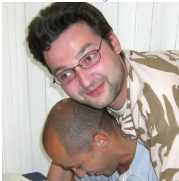
Lavori al piano di sotto!

E infine . . . VERY VERY HOT . . . immagine destinata ad un pubblico adulto: