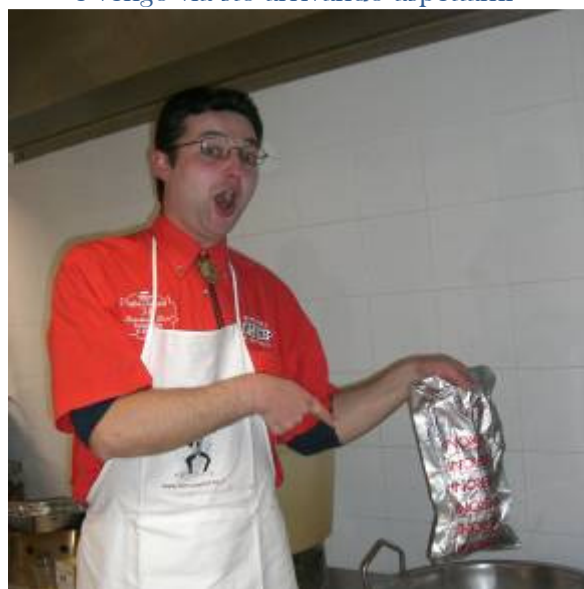
Ho scoperto lo zampone caldo!

E infine . . . VERY VERY HOT . . . immagine destinata ad un pubblico adulto: