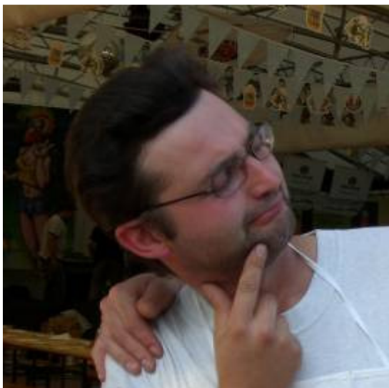
Ma 8 + 5 fa 12 oppure 13??? Bel dilemma...