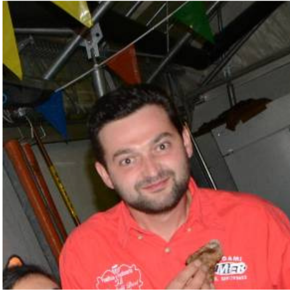
Non ci vedo più dalla fame!