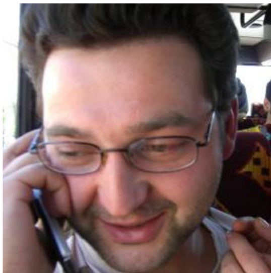
“amore aspettami basta un minuto e vengo via sto arrivando aspettami”