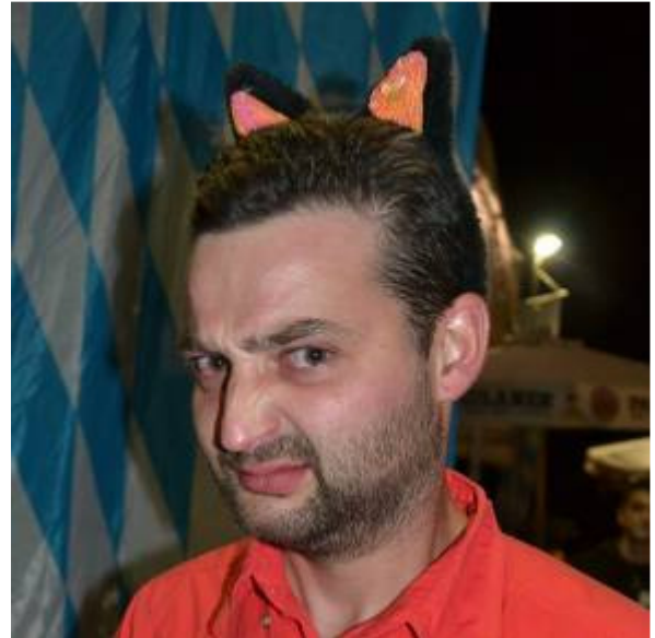
Che bel micione... però forse graffia!