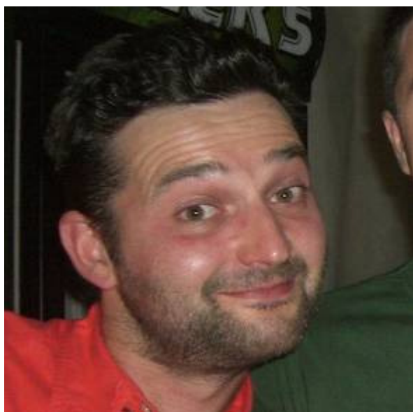
Non ti dico dove ho nascosto la sirena, pappapero!!!