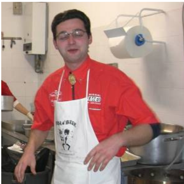
Sogno o son desto?