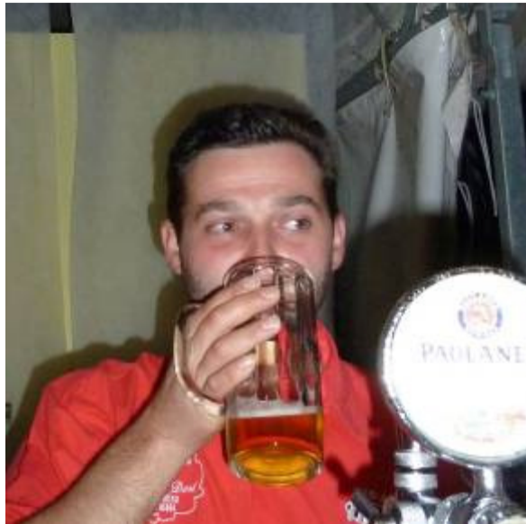
Birra da meditazione