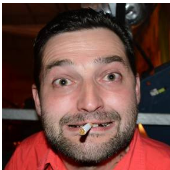
Il fumo nuoce gravemente alla salute