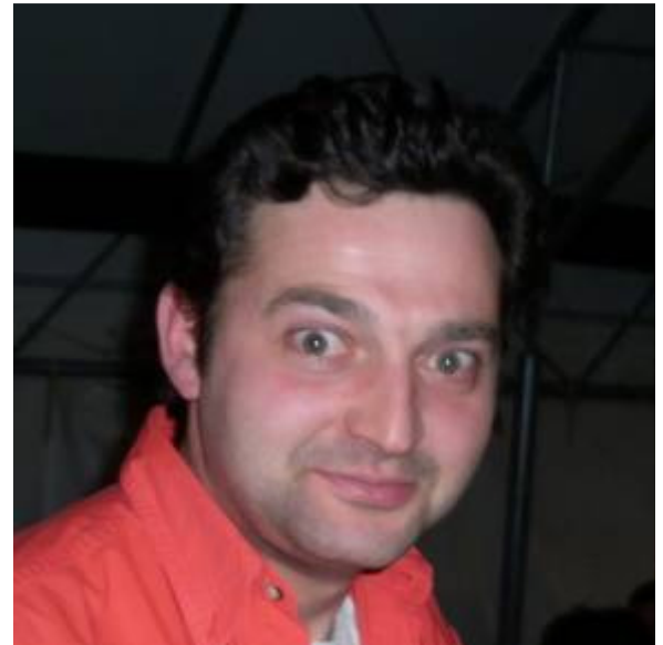
Semplicemente . . .O' PAZZ